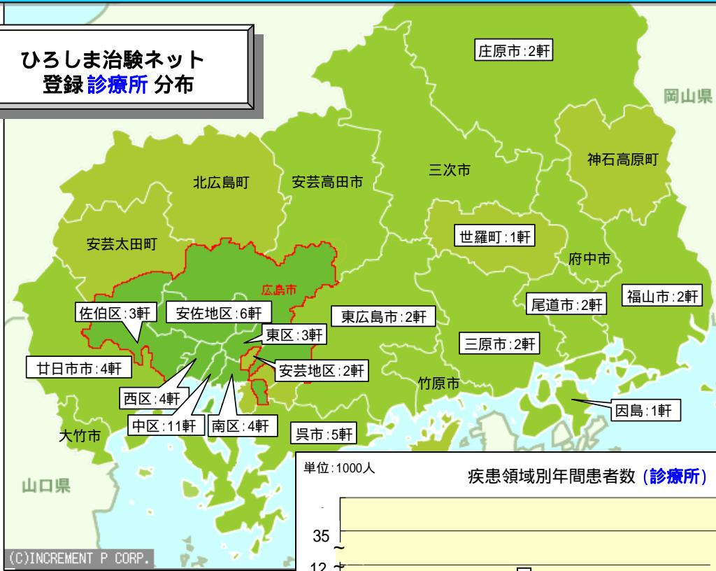
疾患領域別年間患者数 (診療所)